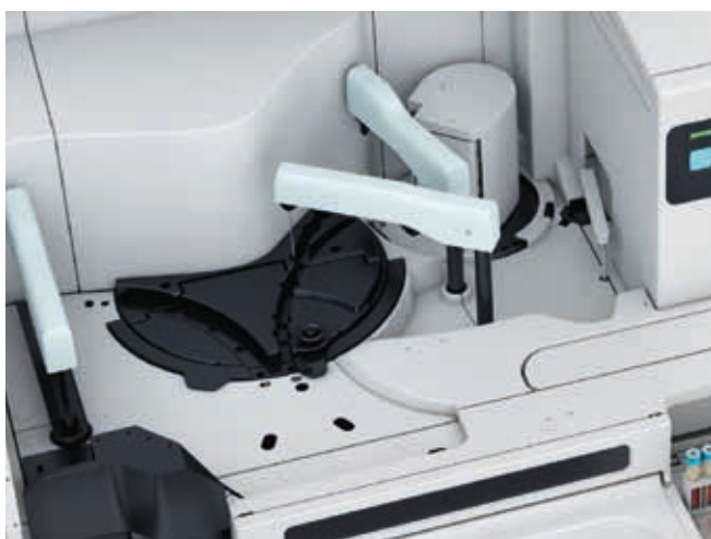
Figura 2 CS-5100 usa tre differenti sonde per dispensare i reagenti, una delle quali è dedicata alla trombina per evitare le contaminazioni ed il rischio di trascinamento ( carry-over ).

I risultati sono più accurati e la gestione dell'operatività richiede meno interventi manuali.